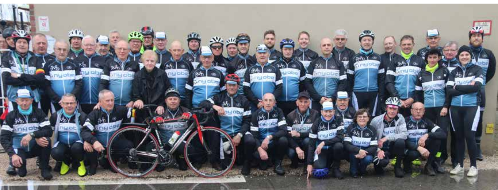
Start van het 20e clubseizoen van WTC De Marolse Duwers.