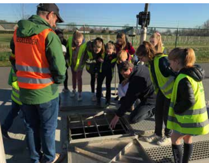
Leerrijke uitstap van de 3de graad van VBS Ouwegem naar het waterzuiveringsstation van Aquafin op Den Bos