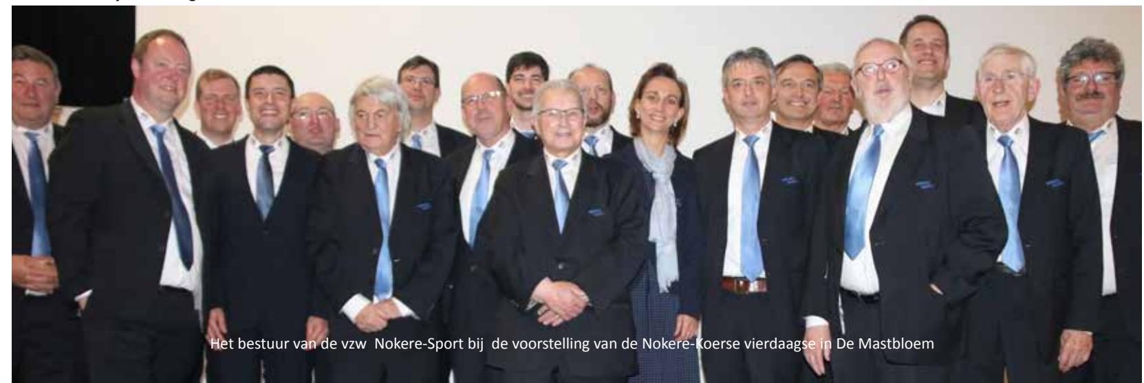
Het bestuur van de vzw Nokere-Sport bij de voorstelling van de Nokere-Koerse vierdaagse in De Mastbloem