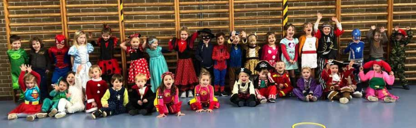
Les kleutersport en -dans in thema 'carnaval'.