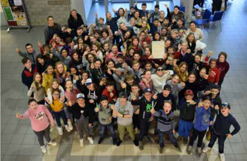
Het 6de leerjaar van de Kruishoutemse scholen tijdens het slotevenement van het MEGA-project.