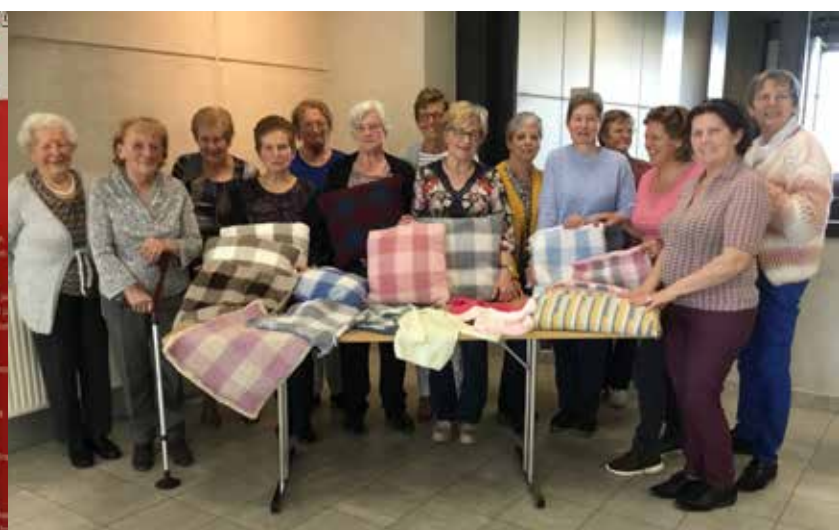
KVLV Ouwegem maakte tijdens de workshop 'Kussens breien en afwerken met weeftechniek' deze mooie kussens.