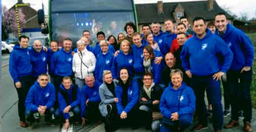
Vzw Drijkeuning Zingem bezocht alle cafés en zalen die hun deuren openen voor het driekoningenfeest