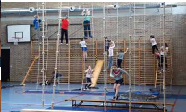
Omnisport-kamp krokusvakantie in de turnzaal van Zingem (27 deelnemers)