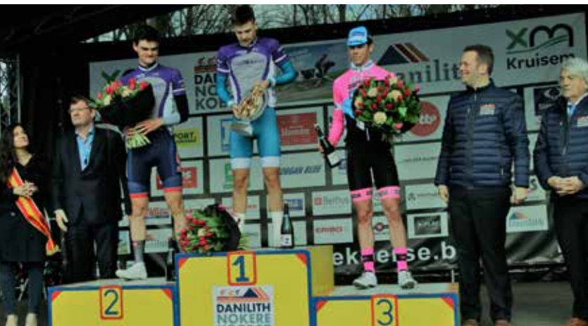
Het internationale podium Danilith Nokere Koerse voor juniors met 150 starters!