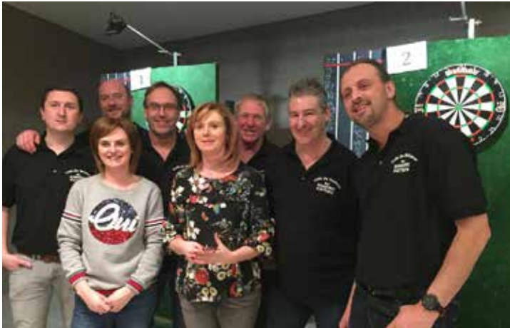
Eerste samenkomst van de nieuwe dartsclub 'd'Auwegemsche Pijlen'.