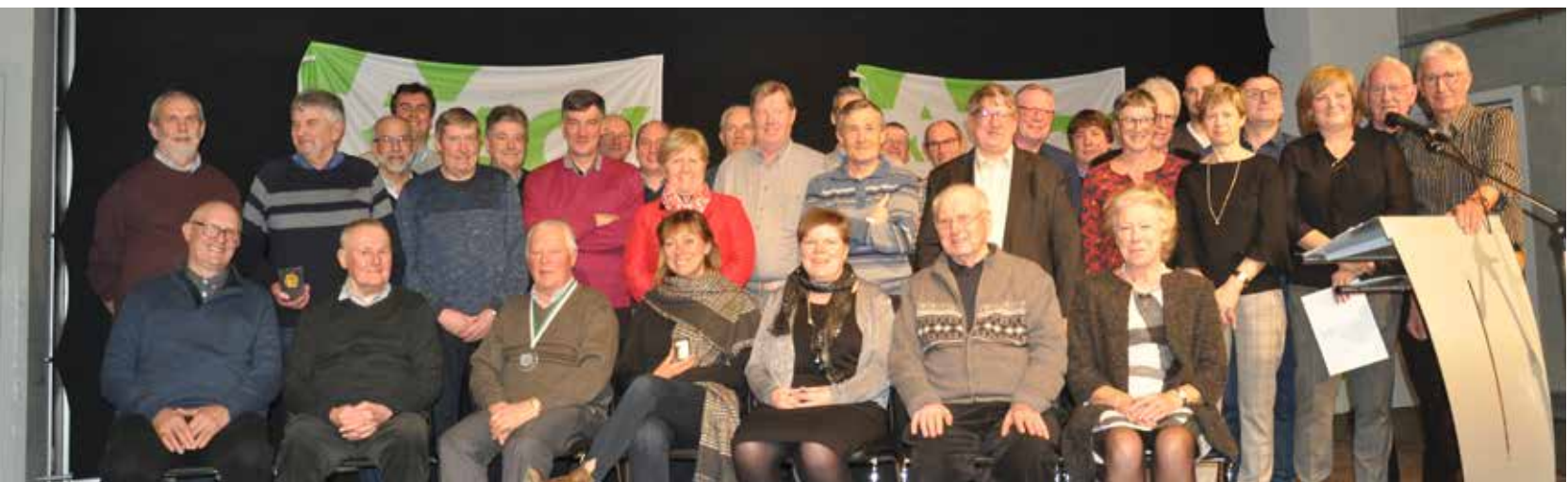
ACV Kruisem huldigde verdienstelijke leden.