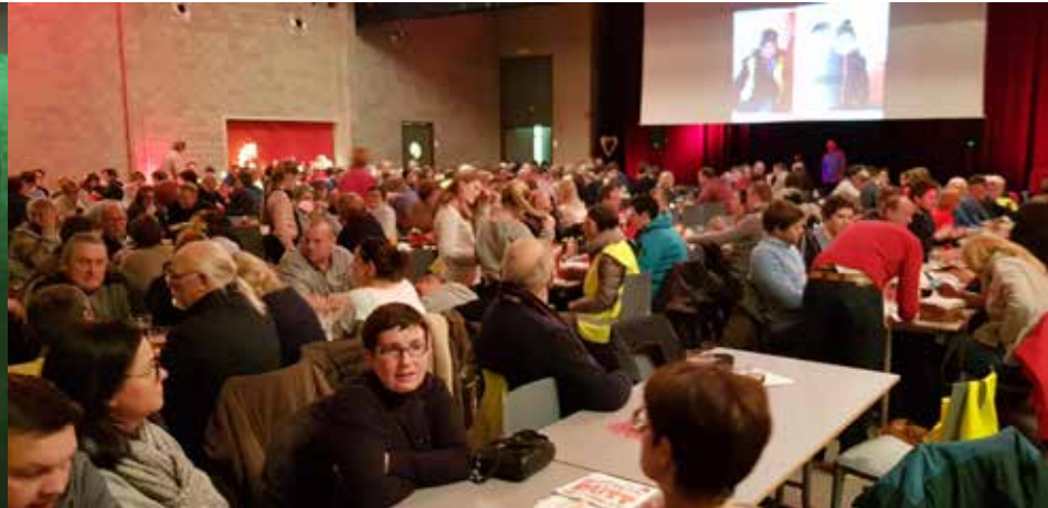
KVLV Kruishoutem telde 850 deelnemers aan de Tour D'Amour wandeling.