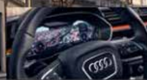
Audi virtual cockpit.

Kom onze technologieën en packs uittesten in echte omstandigheden. Boek nu een testrit en ontdek onze aantrekkelijke voorwaarden voor professionals en particulieren.