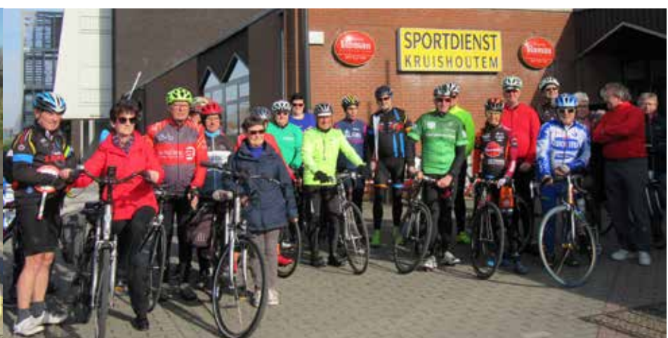
Start sponsortocht ten voordele van vzw Sneukelwiel, georganiseerd door Fonds 1304.