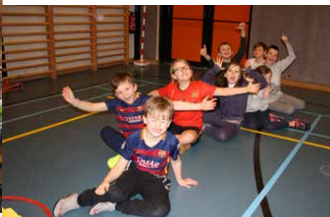
Omnisport-kamp krokusvakantie in de sporthal van Kruishoutem (60 deelnemers)