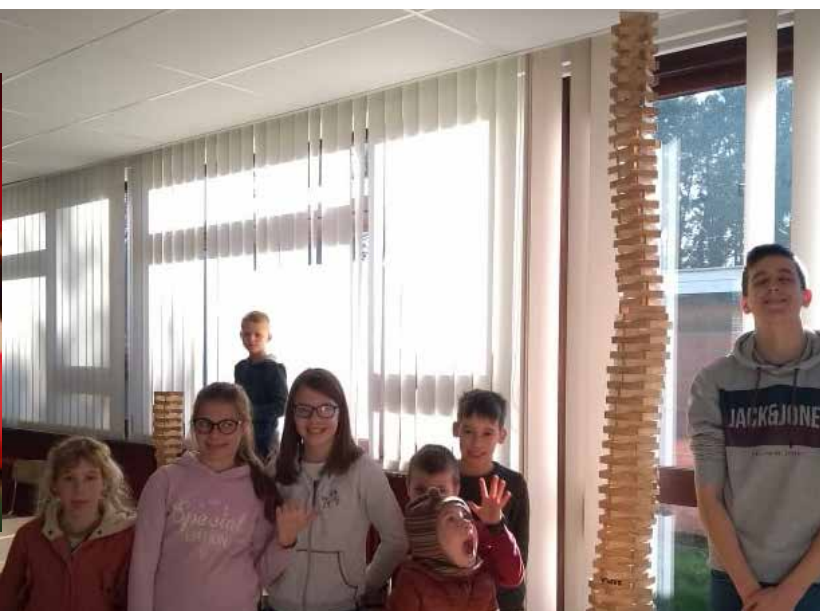
De grootste toren die gebouwd werd tijdens de krokusvakantie was die van Speelpleinwerking Eilaba!