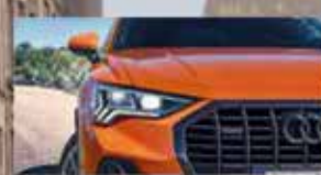
Matrix LED koplampen.