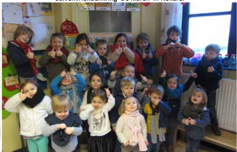
Dikke Truiendag in kleuterschool 'Het Nest' Wannegem-Lede.