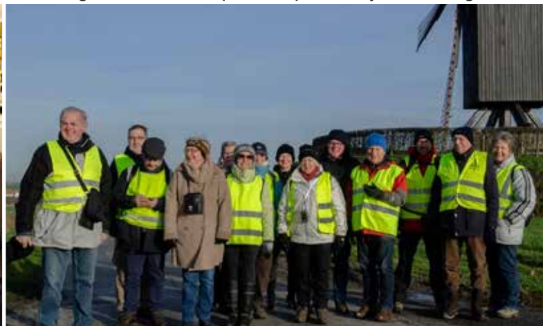
Oefenwandeling Pazar GPS Kruisem in Wanegem.