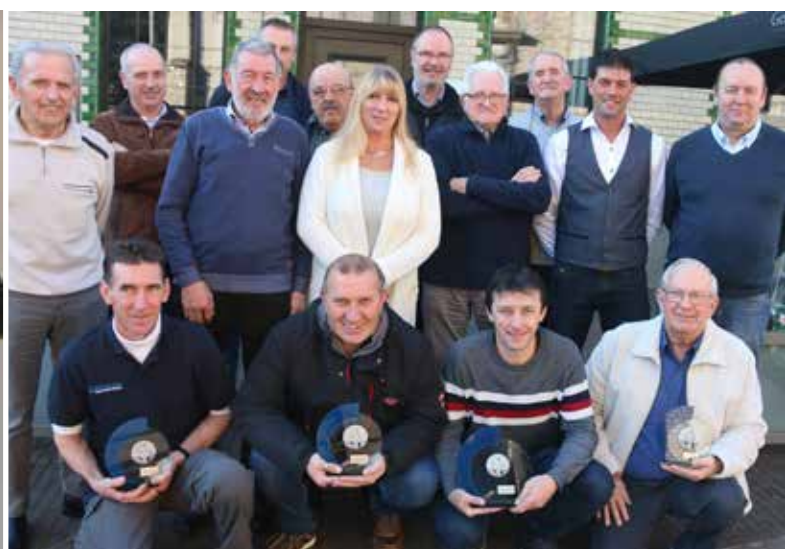
Jaarlijkse kampioenenhulde bij vissersclub 'Recht voor Allen' in Zingem.