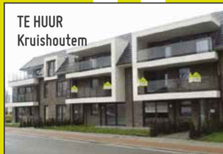
TE HUUR Kruishoutem