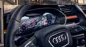
Audi virtual cockpit.

Kom onze technologieën en packs uittesten in echte omstandigheden. Boek nu een testrit en ontdek onze aantrekkelijke voorwaarden voor professionals en particulieren.