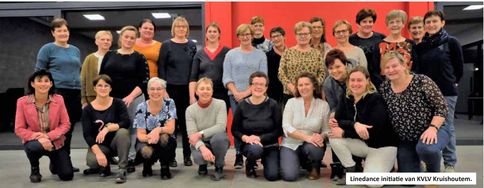
Linedance initiatie van KVLV Kruishoutem.