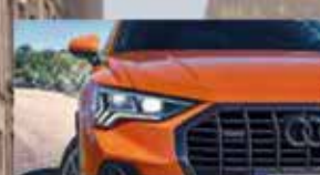
Matrix LED koplampen.