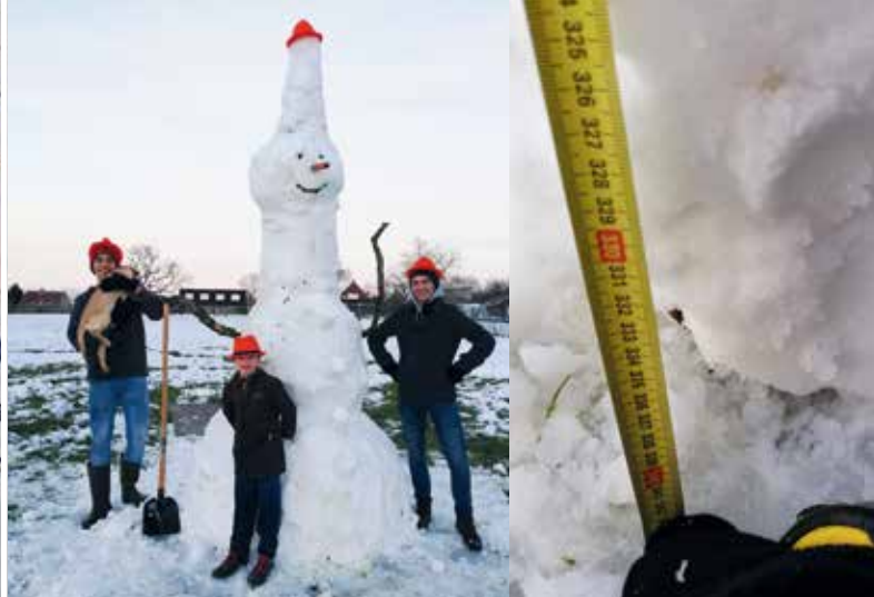
Trotse Kruisemnaren met hun sneeuwman van 3,4 m hoog.