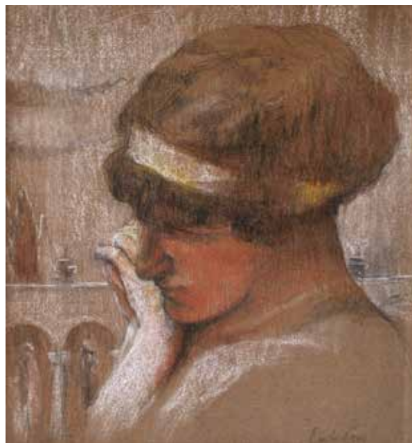
Emile Claus - Meisje met wit lint (1915)