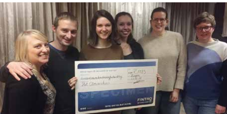
Jongerenvereniging De Jonge W8 schenkt opbrengst van kerstkraampje aan goed doel.