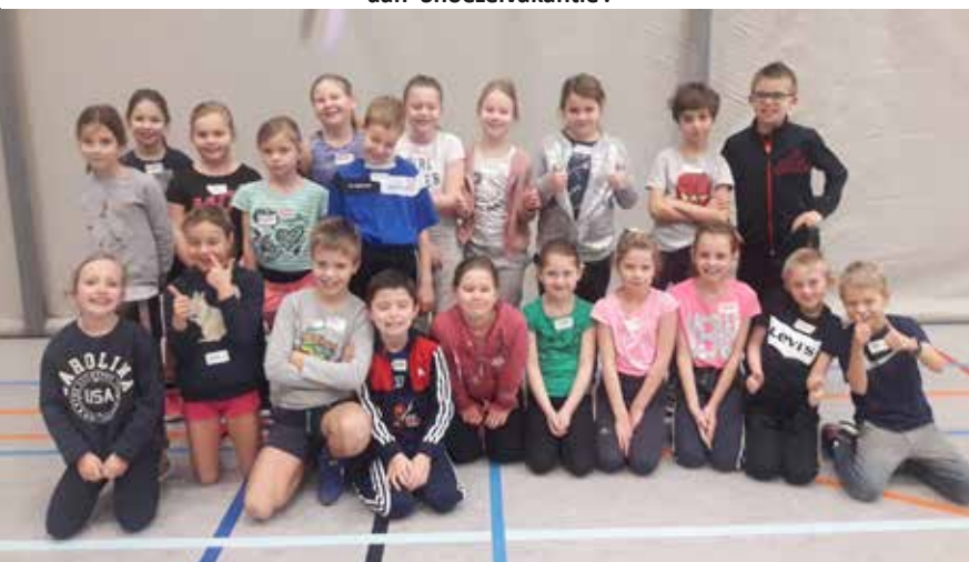
3de leerjaar vrije basisschool Ouwegem tijdens de schoolsportdag in Brakel.