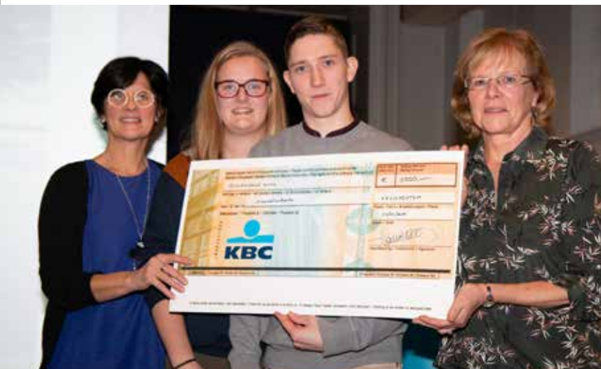
KVLV Kruishoutem schonk 3250 euro, de opbrengst van de 'Wafelstilstand', aan 'Snoezelvakantie'.