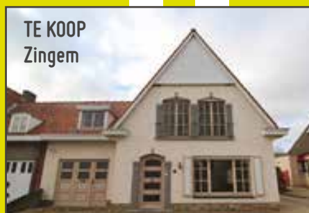
TE KOOP Zingem

NEDERZWALMSESTEENWEG 40B • 9750 KRUISEM • TEL. 09 330 89 08 • WWW.HAUTEKEETEIMMO.BE