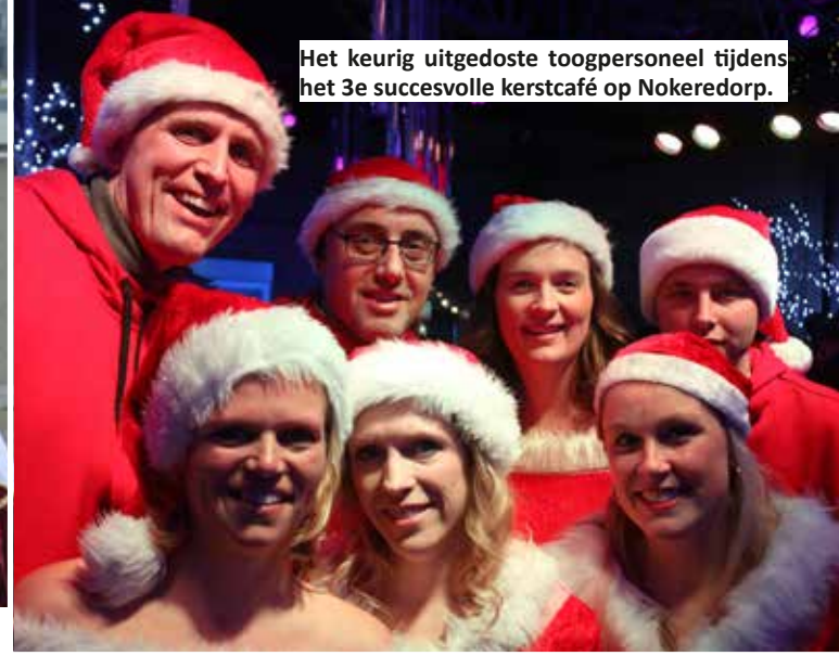
Het keurig uitgedoste toogpersoneel tijdens het 3e succesvolle kerstcafé op Nokeredorp.