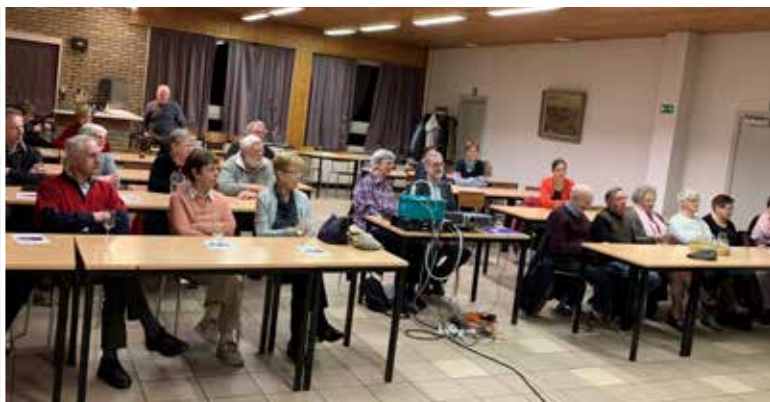
Vtb-Kultuur organiseerde de laatste activiteit ooit in zaal de Kring. Historisch moment.