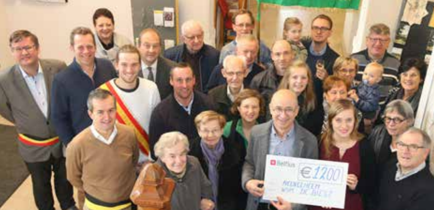
Jubilarend (50 jaar) wijkcomité De Biest schonk 1 200 euro aan Heuvelheim.