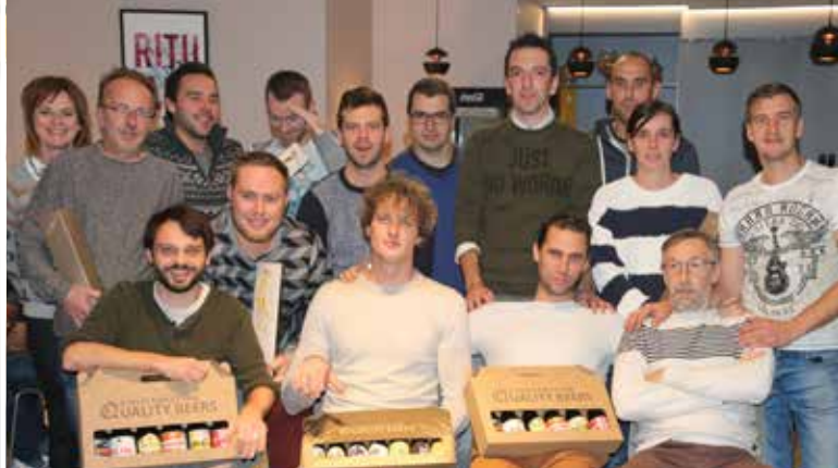
Top-3 van 2de quizavond van VK Nieuwe Wijk Lozer.