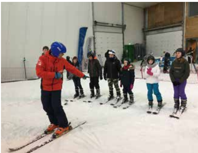
Wintersportdag kerstvakantie in Skidôme Terneuzen - 28 december 2018

Locatie: Mastbloem (Waregemsesteenweg 22 in Kruishoutem)