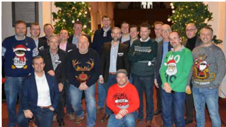
Kerstconcert van Voicemale in Nokere