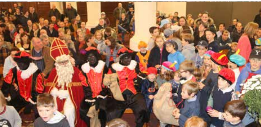
Sinterklaasfeest in Nokere