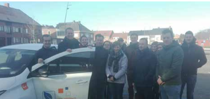
Cambio autodelen nu ook in Kruisem! Voorstelling van de 1ste elektrische deelwagen