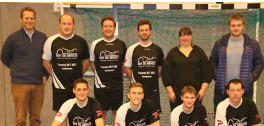
Het lokale minivoetbalteam 'Hoogstraat 9' won de wisselbeker van de sporthal Kruishoutem.