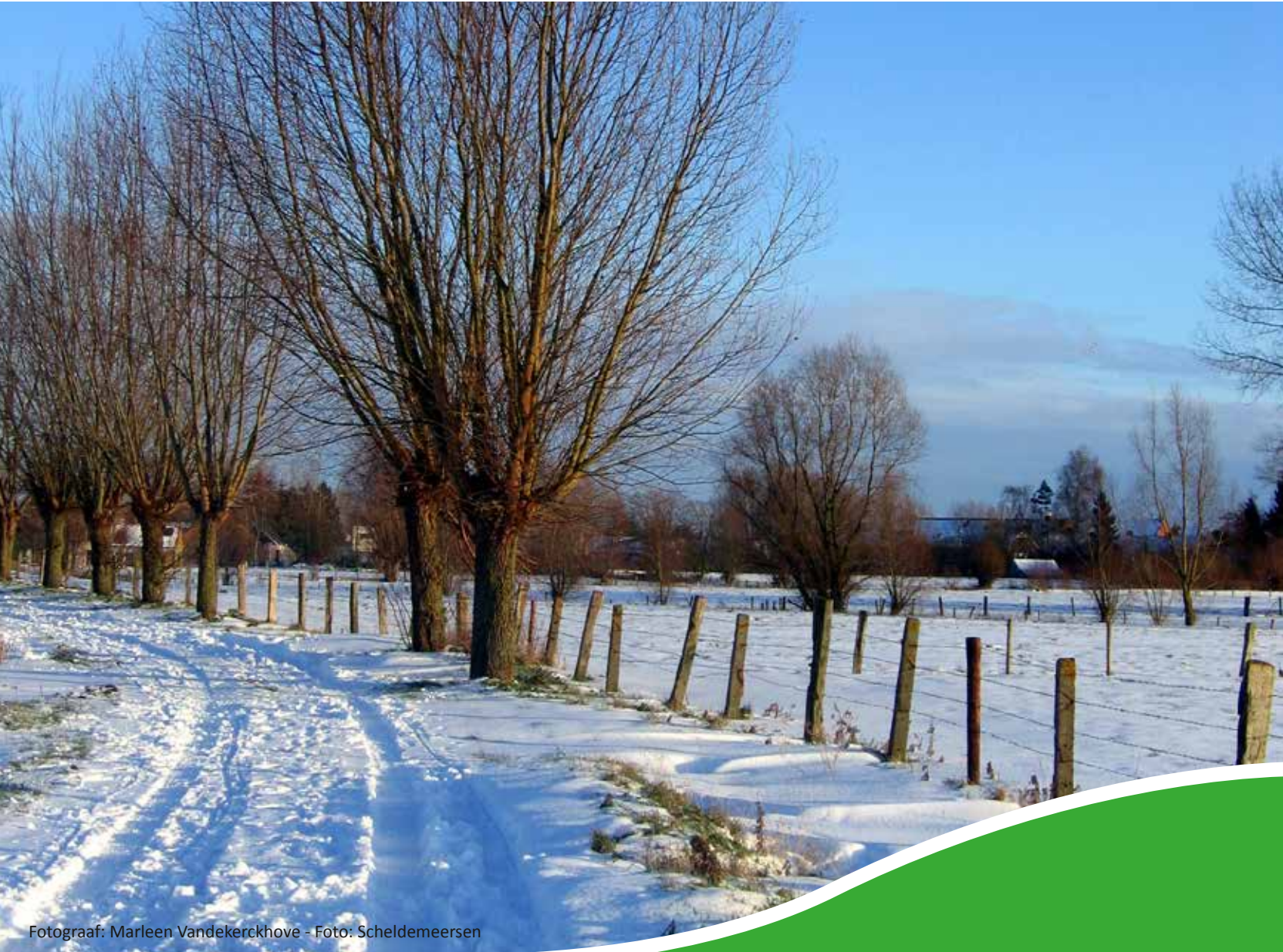
Fotograaf: Marleen Vandekerckhove - Foto: Scheldemeersen

Maandelijks, behalve in augustus Jaargang 1 - nr. 2