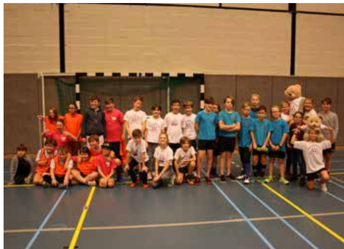
Winnaars minivoetbaltornooi jongeren: Basisschool de Keimolen - 9 januari 2019 - 5e en 6e leerjaar Kruishoutemse scholen