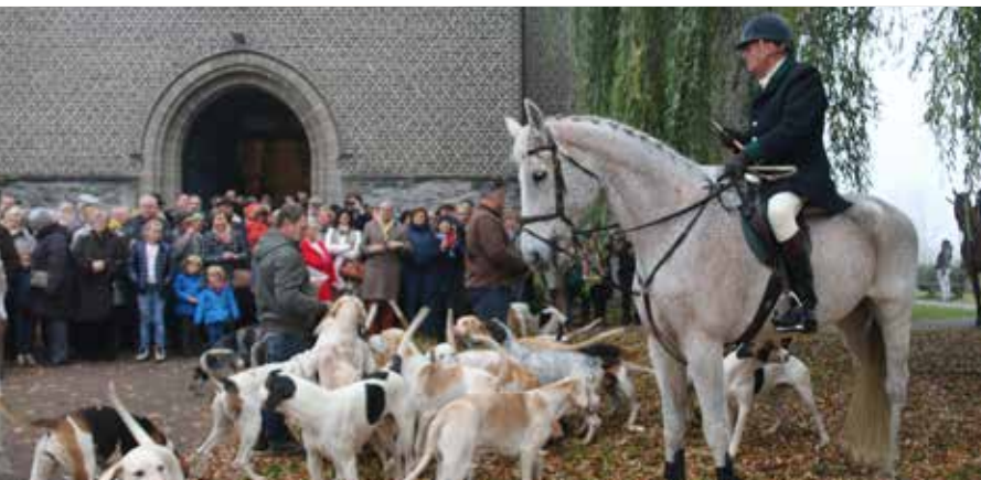
Sint-Hubertusfeest met meute jachthonden in Nokere (org. Rotary Kruishoutem).