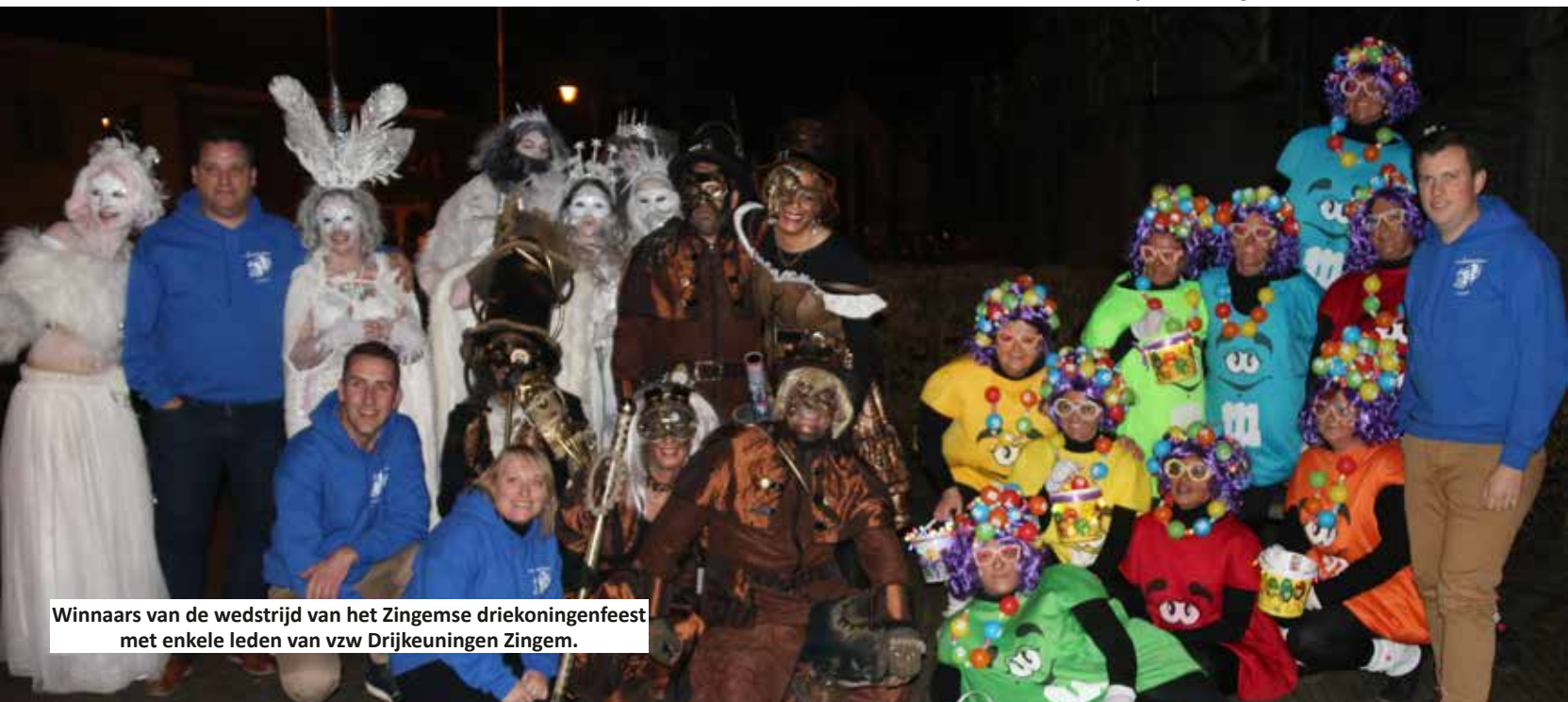
Winnaars van de wedstrijd van het Zingemse driekoningenfeest met enkele leden van vzw Drijkeuningem Zingem.