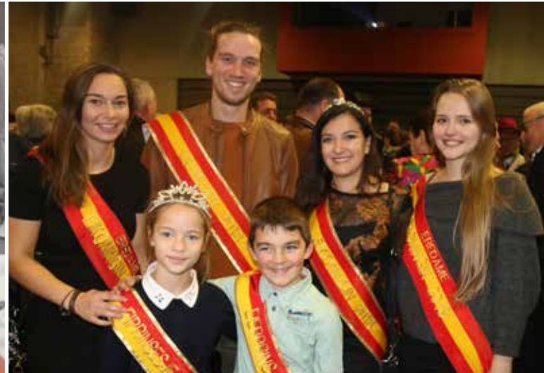
De ambassadeurs van de Eifeesten 2018 waren aanwezig op de 1e nieuwjaarsreceptie van Kruisem.