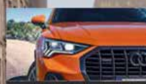
Matrix LED koplampen.