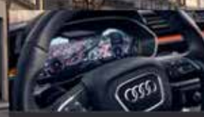
Audi virtual cockpit.

Kom onze technologieën en packs uittesten in echte omstandigheden. Boek nu een testrit en ontdek onze aantrekkelijke voorwaarden voor professionals en particulieren.